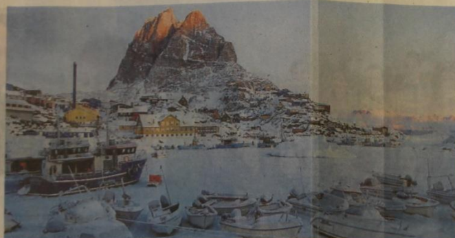
Comme Granville, Uummannaq est un port de pêche. Les deux communes sont jumelées depuis 2011.

Le Groenland a été au cœur de l'actualité en 2025 avec Trump... Oui, cette année est un peu spéciale