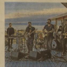
Le groupe pop rock groenlandais Nanook se produira à Bréhal le vendredi 14 novembre.

Nanook, ce sont cinq musiciens (deux guitaristes, un bassiste, un pianiste et un batteur) qui chantent uniquement en groenlandais. C'est la première fois que le groupe se produit en France. « Nous avons pour habitude, pendant les interludes, de présenter nos chansons au public et de leur expliquer les thèmes qu'elles abordent comme la nature magnifique de notre pays, ses contrastes culturels, l'espoir », nous confiaient-ils. Rendez-vous à la salle polyvalente de Saint-Martin, à Bréhal, le vendredi 14 novembre à 21 h. Tarifs : de 7 à 17 €.